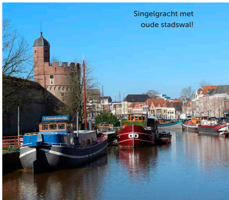
Singelgracht met oude stadswal!