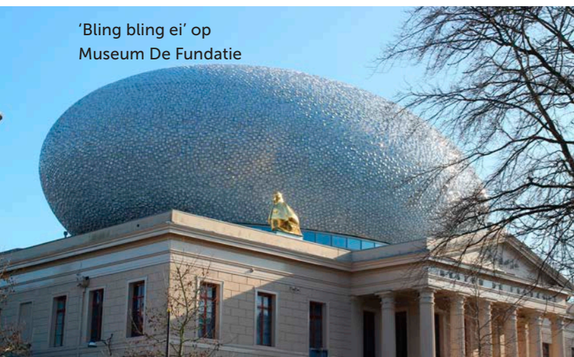
'Bling bling ei' op Museum De Fundatie