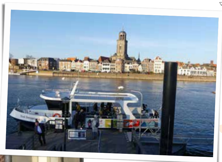
Zicht op Deventer aan de IJssel. ▾