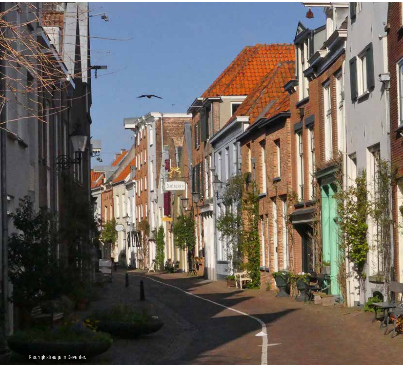
Kleurrijk straatje in Deventer.